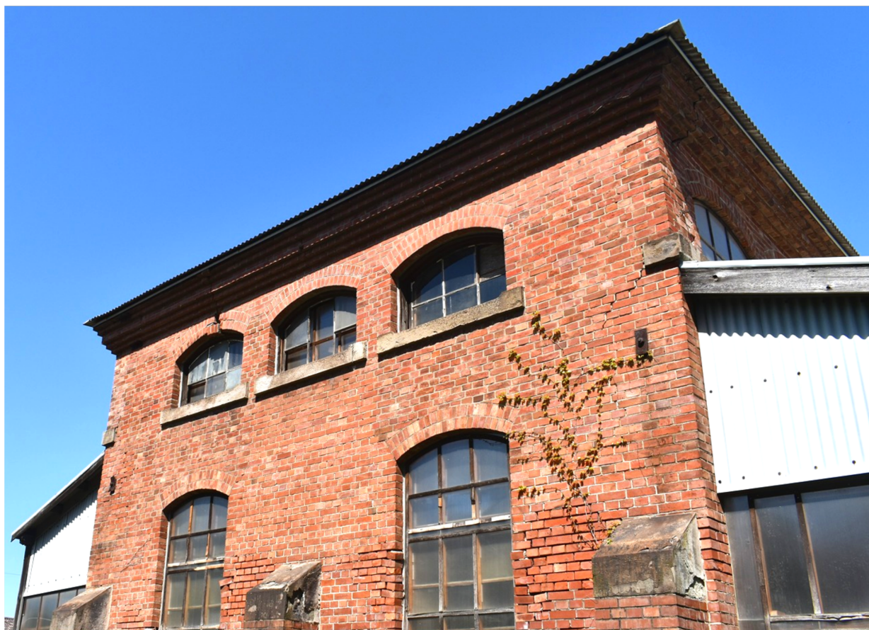
写真：旧鉄道聯隊材料廠煉瓦建築（県指定文化財）千葉経済大学敷地内